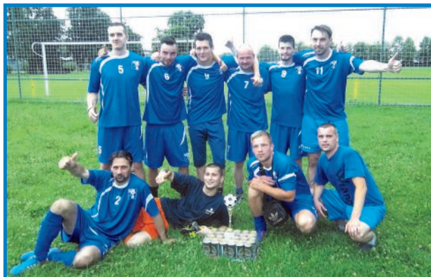
Jeden z týmů, který se účastnil turnaje v minikopaně