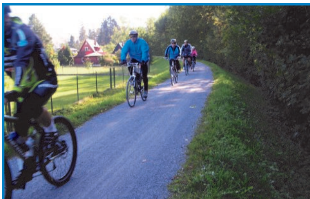
Z cyklistické akce