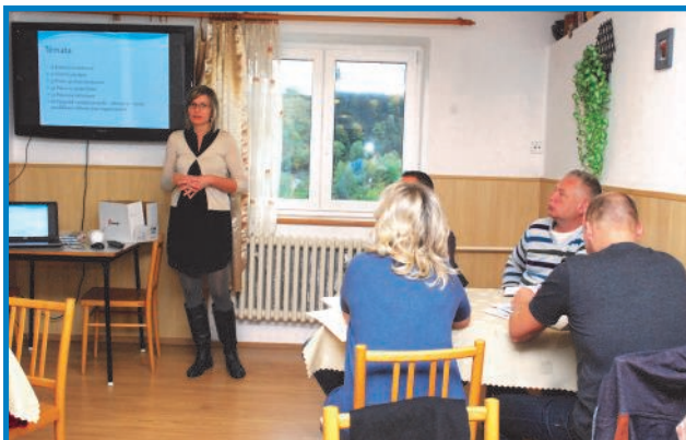
Ze školení funkcionářů z OSV k legislativě

Fotografie jsou z činnosti OSV z období druhého pololetí.