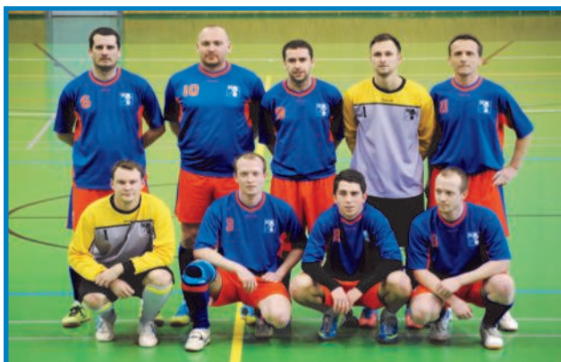
V Košicích v GOLDEN TOUR tým ZO OS KO Ocel. konstr. nepostoupil do čtvrtfinále