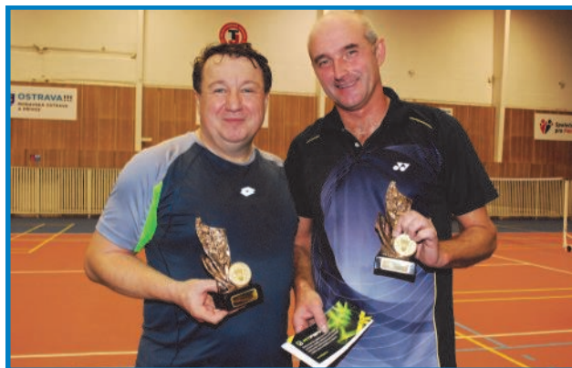
Vítězný pár v badmintonu z Hutních montáží